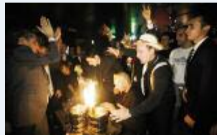
ALCUNI SCATTI DEL PARTY SVOLTOSI IL 10 NOVEMBRE A MILANO.

L'irriverenza del team Da Boot è nota almeno tanto quanto la sua professionalità. Un mix esplosivo che dà vita a progetti originali rigorosamente contornati da serate festaiole. Entrambi questi elementi sono stati protagonisti dell'ultimo mese della crew Da Boot, che dal 10 al 13 novembre ha preso parte al 69° Salone Internazionale del Motociclo di Milano. Durante la fiera, è stato presentato in anteprima il nuovo video Da Boot. La cui preview ufficiale si è tenuta il 10 novembre proprio durante un party a tema presso il locale 11Clubroom.