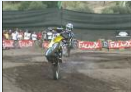
SOPRA E A FIANCO, FRAME DEL PERIODO 2004-2006.