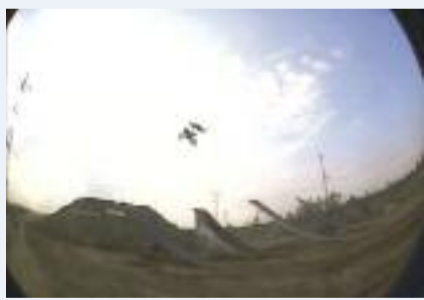
UN'IMMAGINE DELL'EPOCA 2006-2009.